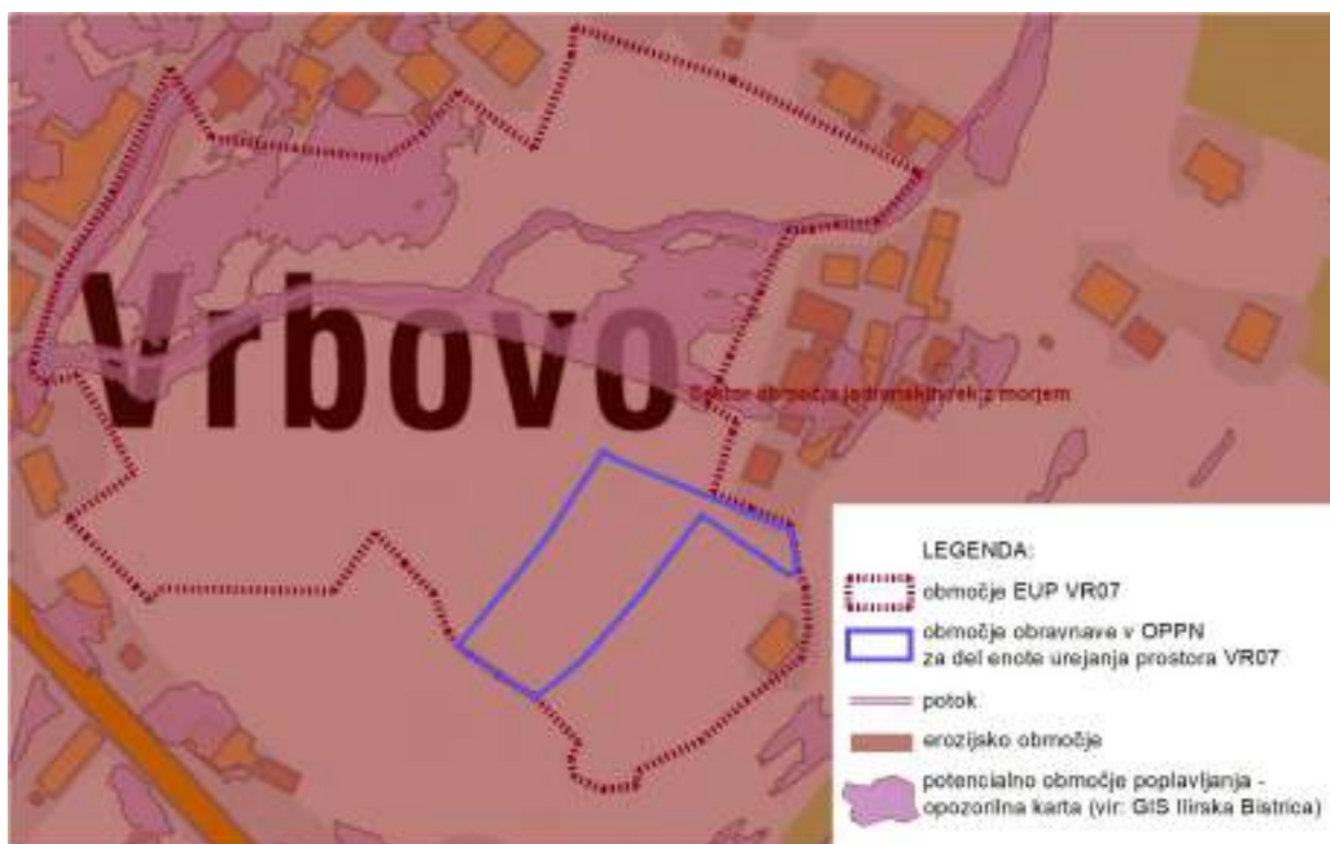
Prikaz stanja voda na območju OPPN