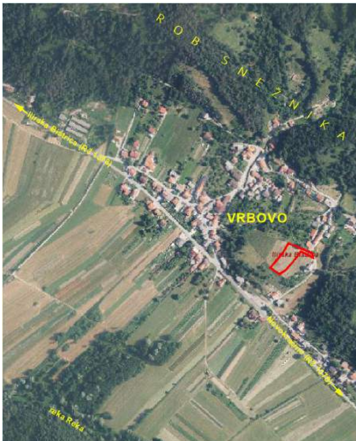
Prikaz območja, ki ga obravnava OPPN za del EUP VR07