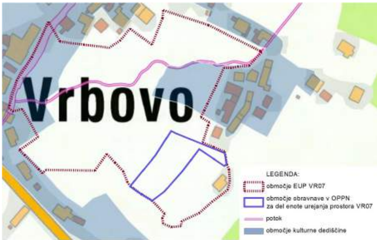
Prikaz zavarovanih območij s posebnimi predpisi: kultura