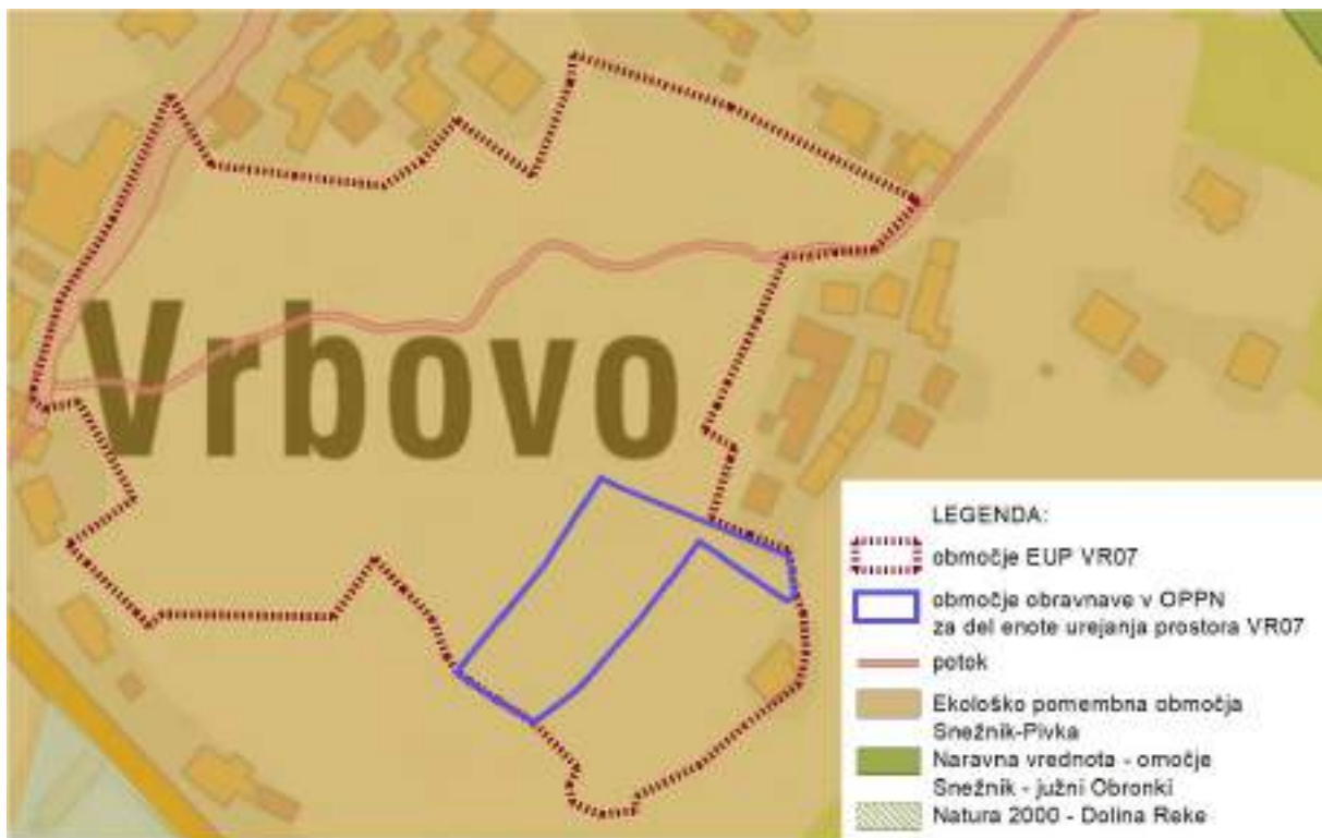
Prikaz zavarovanih območij s posebnimi predpisi: narava